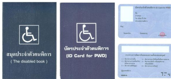
ตัวอย่างบัตรและสมุดประจำตัวคนพิการ

* กรณีได้รับเบี้ยยังชีพคนพิการอยู่แล้วและได้ย้ายเข้ามาในพื้นที่ ตำบลปะคำ จะต้องมาลงทะเบียนที่ องค์การบริหารส่วนตำบลโนนขวาง อีกครั้งหนึ่งภายใน ๑ มกราคม - ๓๐ พฤศจิกายน ของทุกปี